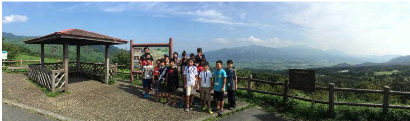
帰路・展望所から南阿蘇村の眺め