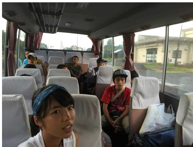
帰りのマイクロバスの中の参加者。

引率のリーダー-3人。 右は、帰りのマイクロバスの中の参加者。 楽しいキャンプに、なったでしょうか？